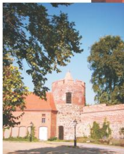
Stadtmauer mit dem "Storchenturm"