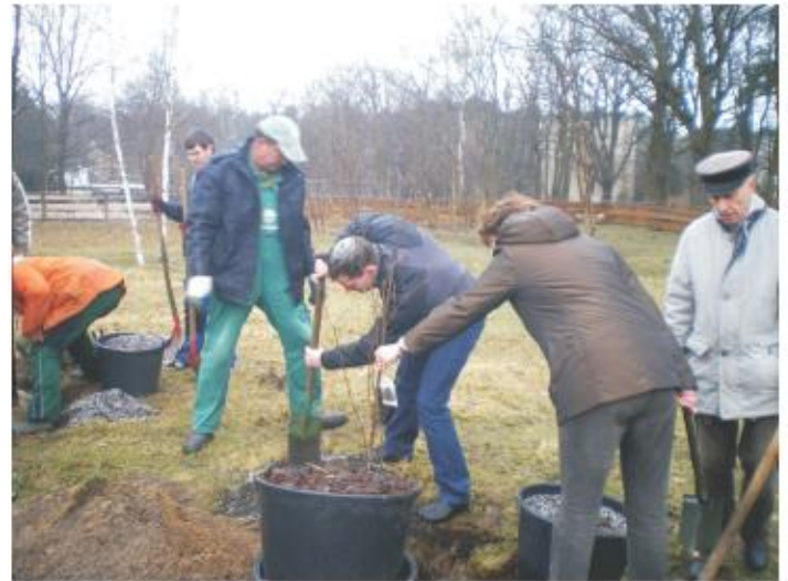
Gemeinsame Baumpflanzaktion von Bürgerinnen, Bürgern und Politikern am Kinder- und Jugendhof Beeskow

Damit brachten sie ihre Auffassung zum Ausdruck, dass sie eine Lagerung von CO 2 generell als zu hohes Risiko für die Menschen, für Natur und Umwelt ansehen. Weitere Protestaktionen folgten im Verlauf des Jahres.