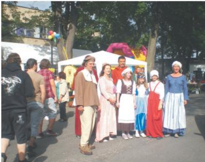
Einige der Organisatoren in historischen Kostümen

Nicht nur für die Bahrendorfer, sondern auch für andere Beeskower und Besucher attraktiv, ist das Straßenfest ein interessanter Veranstaltungstipp. Also: Vormerken.