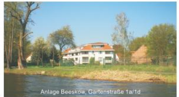
Anlage Beeskow, Gartenstraße 1a/1d

Katharinenstraße 19 in 10711 Berlin Telefon 030 - 89 04 31 - 80, Fax 030 - 39 04 31 - 51 E-Mail: info@immo-plan-berlin.de