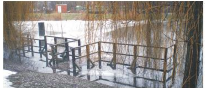
Steganlage Schleuse - Hafenanlage Spreeinsel