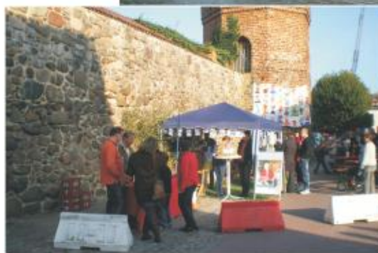
Entlang der Stadtmauer stellten sich Vereine der Stadt Beeskow vor

Dieses Ziel wurde im Familienkatalog des Familienbündnisses Beeskow formuliert. Auf der Veranstaltung stellten sich potentielle Partner dieses Bündnisses vor, zeigten ihre Leistungsfähigkeit und warben für neue Mitglieder.