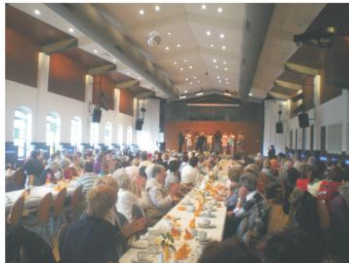
Feier zum 20. Jubiläum des Frauenladens