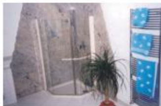
Badelemente aus Naturstein

Das Angebot an Dienstleistungen sehen Sie im Inserat auf Seite 30