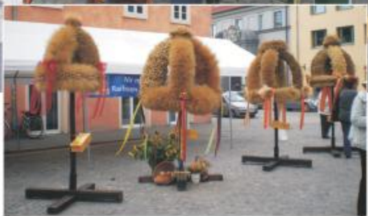
Wer hat(te) die schönste Erntekrone?

Gründung des Familienbündnisses - "Wir wollen eine zukunftsfähige Stadt gestalten. Kinder- und Familienfreundlichkeit ist unser zentrales Anliegen. Wir sehen es als unsere Aufgabe an, die Lebensbedingungen von Kindern, Jugendlichen, Familien, älteren und behinderten Menschen positiv zu gestalten und das Zusammenleben der Generationen und Kulturen zu verbessern."