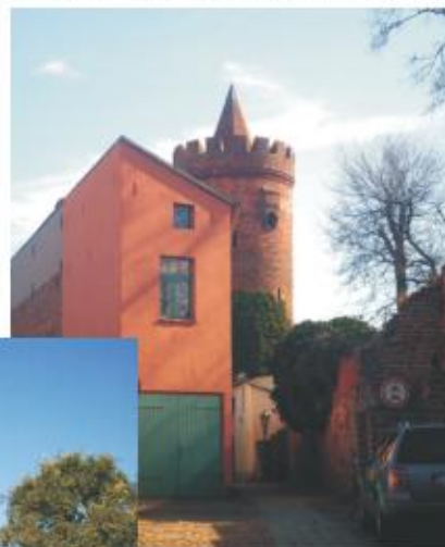
"Dicker Turm", von der Mauerstraße aus gesehen

Ist geplant, weitere kleine Räumlichkeiten, in der Stadtmauer gelegen, für die Ansiedlung von Gewerbetreibenden zur Verfügung zu stellen?