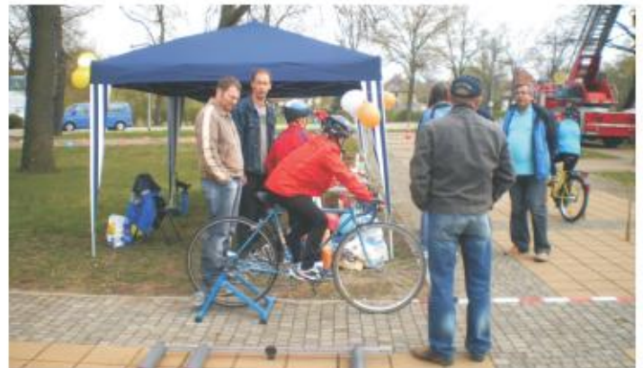
Am Stand der Verkehrswacht

Beeskow radelt an - Eine traditionelle Veranstaltung, bei der es um sportliches Können, körperliche Betätigung, Wissenserweiterung, Spaß und Spiel ging. Je nach Kondition ging es auf vier Touren über 5-40 km Strecke durch die Umgebung. Dominierend: Unsere älteren Mitbürger.