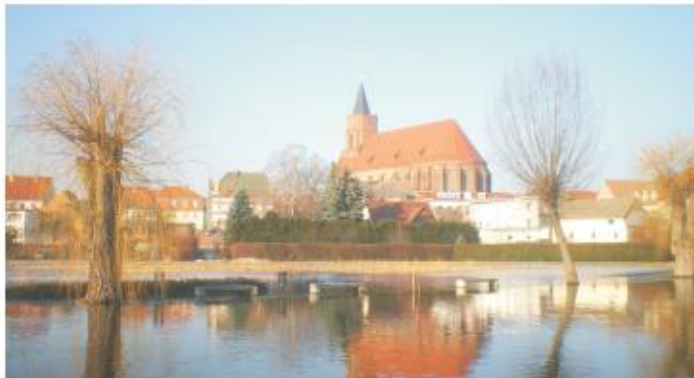
Die Spreepromenade steht unter Wasser

Wir haben einige Schnappschüsse gemacht, die wir Ihnen nicht vorenthalten möchten.