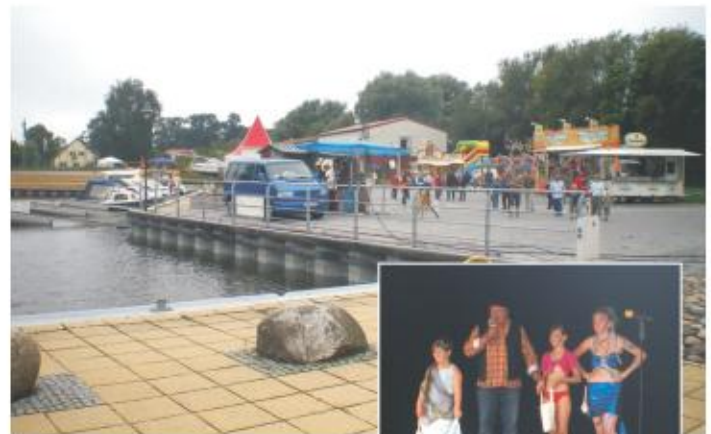
Hafenfest auf der Spreeinsel und Miss-Nixe-Wahl 2010

Dies tat aber der guten Stimmung der Gäste keinen Abbruch und die kleinen Teilnehmer der "Miss-Nixe-Wahl" hatten trotzdem großen Spaß. Wir drücken dieser Veranstaltung für dieses Jahr die Daumen!