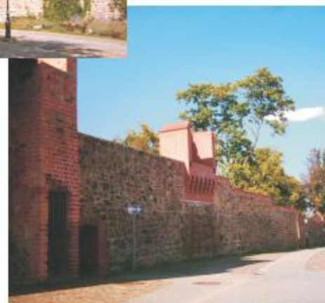
Stadtmauer, vom "Münzturm" aus fotografiert