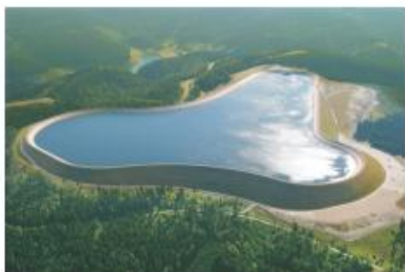
Am Fließchen Schwarzza in Thüringen liegt das Laufwasserkraftwerk Goldistal

So ist Vattenfall der größte Betreiber von Pumpspeicherwerken in Deutschland, aber auch bei Biomasse und Windkraft sieht Vattenfall Wachstumschancen. Allein die sechs Laufwasser-Kraftwerke produzieren in Thüringen und Sachsen bei Vollbetrieb rund zehn Megawatt Strom.